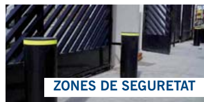
ZONES DE SEGURETAT