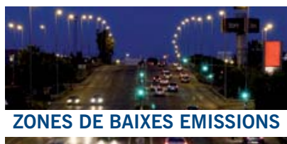
ZONES DE BAIXES EMISSIONS